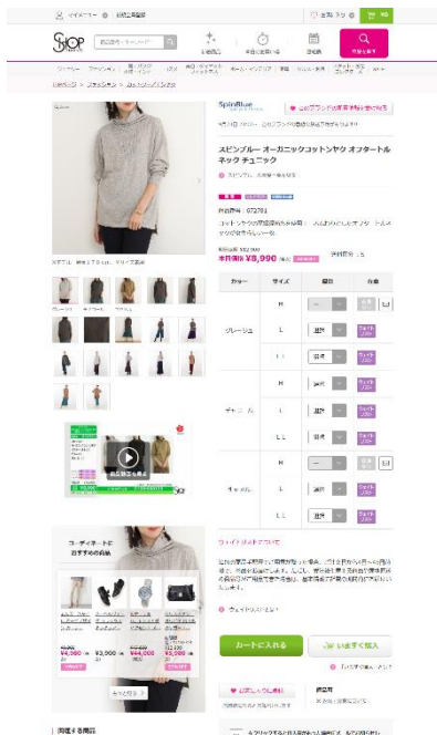
ファッションの商品ページに「コーディネートにおすすめの商品」と表示